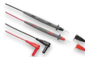
Sada měřicích kabelů Premium TL71-1