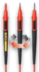
Měřicí kabely Twistguard™ TL175E (4 mm)