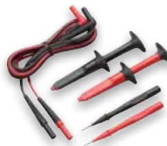
Sada elektrických měřicích kabelů TL223-1 SureGrip™